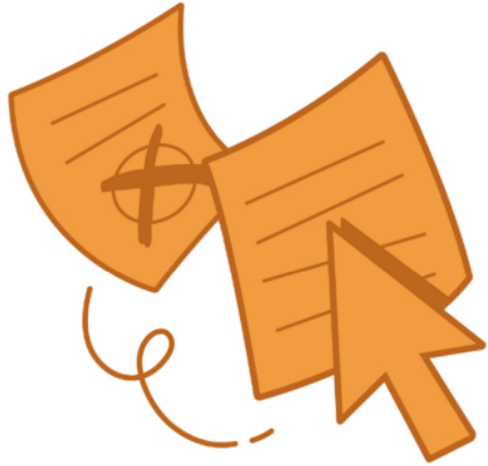
Regeln für das Miteinander