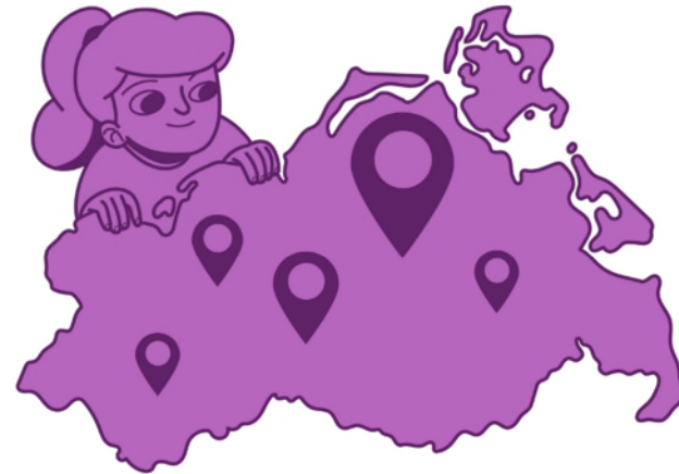
Spielplätze / Orte für Kinder